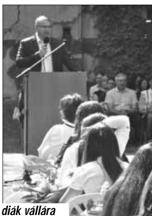
A Kossuth utcai iskolából 35 diák vállára került a ballagótárisznya