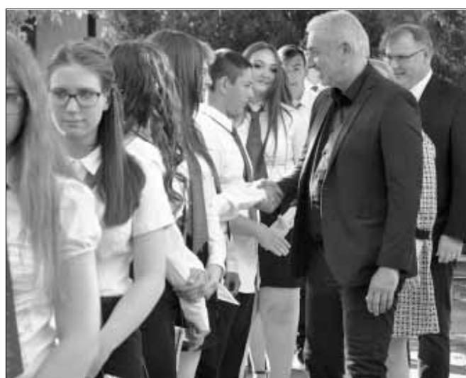
A fenti képek a Gyulai úti iskolában készültek