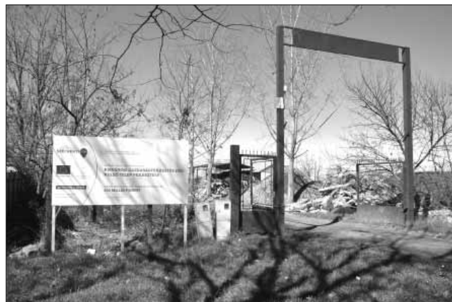
Már elkezdődtek az előkészítő munkálatok