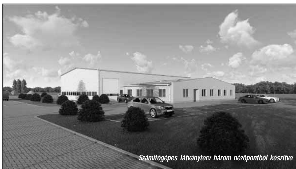
Számítógépes látványterv három nézőpontból készítve

úton hagyja el a várost, az két jelentős beruházásra is felfigyelhet. Egyrészt az önkormányzat által megvalósított közösségi pályázat eredményeként a Sarkadkeresztúri úton épül a Sarkadi Pelikán Vadásztársaság tulajdonába kerülő természetjáró közösségi ház, amit az elmúlt héten már részletesen bemutattunk, másrészt az is feltűnhet, hogy a természetjáró közösségi ház szomszédságában is gőzerővel dolgoznak. A munka a Városgazdálkodási Iroda ügynevezett külső telepén folyik, ahol egy sikeres pályázatnak köszönhetően, nettó 200 millió forintból egy iparterület fejlesztési projektet valósít meg az önkormányzat.