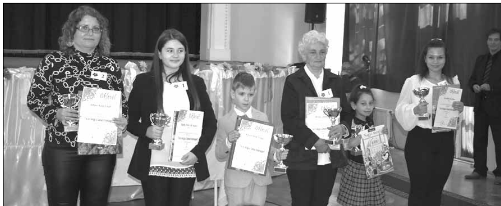
Az I. helyezettek