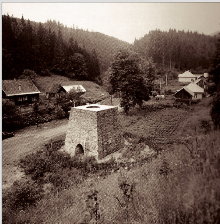
1. kép. A háromvízi helyreállított nagyolvasztó

A Zólyom vármegyei Libetbányát német hospesek alapították a 13. században, 1382-ben szabad királyi bányaváros lett. Aranybányái kimerülvén, a vasbányászatra tértek át, egy bucakemencét és hámort 1632-ben említenek először. Ennek helyén 1692-ben építtetett fel a kamara, a sziléziai Carl Philip Kropf kezdeményezésére, egy 7 láb magas és 1 láb 8 hüvelyk széles nagyolvasztót, amely az első volt Magyarországon. A kohó 13 fős személyzetét Kropf Jägerdorfból hozta magával. Naponta 8–9 bécsi mázsa nyersvasat termeltek, amely jelentős foszfortartalma miatt jól önthető volt, közvetlenül a nagyolvasztóból tűzhelylapot, konyhai edényt, mozsarat öntöttek. Miután Kropf viszonya a kamarai tisztviselőkkel és a munkatársaival megromlott, 1695 végén hazament Sziléziába, s a nagyolvasztó rövidesen leállt. A Rákóczi-szabadságharc alatt, 1704 szeptemberétől 1708 őszéig ágyúgolyót és bombát öntöttek a kurucoknak, majd ezek visszavonulása után, a szatmári békéig a császáriak számára.