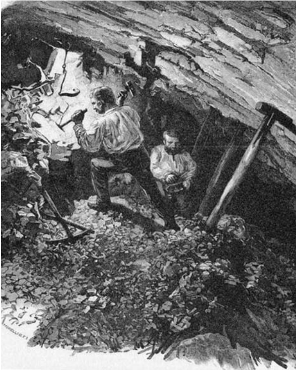
2. ábra: Egy munkahely a bányában

gok (2. ábra). Megszaporodott az újságok száma.