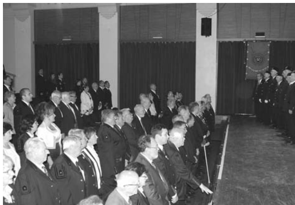
A Küldöttgyűlés jegyzőkönyve alapján összeállította: PT

A Küldöttgyűlés a Bányász-, a Kohász- és az Erdészimnuszok eléneklésével zárult, melyeket a megnyitóbani magyar Himnuszhoz hasonlóan a tatabányai Rozmaringos Bányász Egylet intonált.