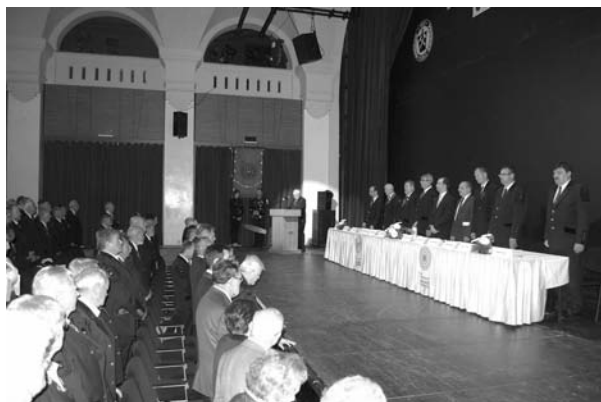
Tiszteletadás az elhunytaknak