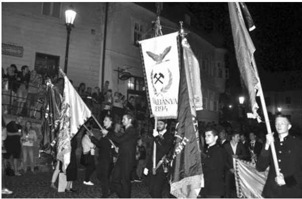
3. kép: OMBKE-zászlók a felvonuláson

legfegyelmesebben vonuló, legjókedvűbb, legbarátságosabb és döntően a legnagyobb csoport a miénk, hiszen mi majdnem annyian vagyunk, mint az összes többi felvonuló együttesen. A nagy létszámú résztvevő eredményeként szinte lehetetlen volt az egységes éneklés. A felvonulási menet végén a fúvószenekar eljátszotta, a körülötte összegyűlt felvonulók pedig elénekelték a Bányászhimnuszt.