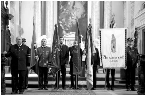
1. kép: Zászlók a Nagyboldogasszony templomban (jobb szélen a tatabányai)

Hamar eljött az ebédidő, ami után elindultunk Hodrusbányára, ahol egy föld alatti és feletti múzeum várt ránk (2. kép).