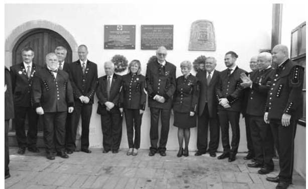
1. kép: Emléktábla-avatás

Délután 13 órakor Selmecebánya város és a Szlovák Bá-