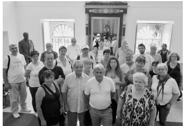
3. kép: A Keglevich kastélyban