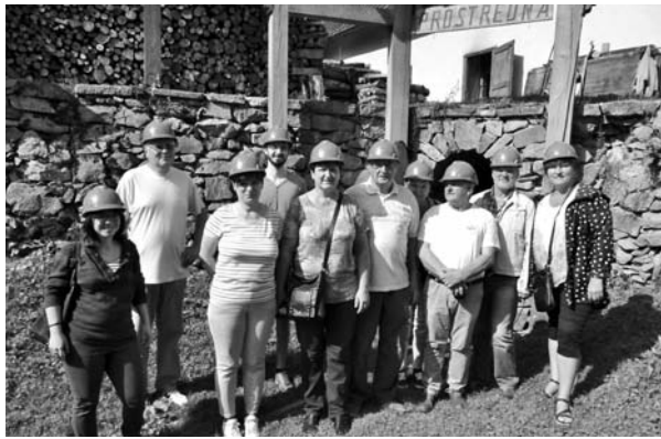
2. kép: A bányamúzeum előtt

A Hodrushátori Mindenszentek ércbányában arany- és ezüstércet bányásztak, s több mint 7 évszázadon keresztül működött. Az első írásos emlék a bányáról 1378-ból való, a fejtést 1950-ben fejezték be.