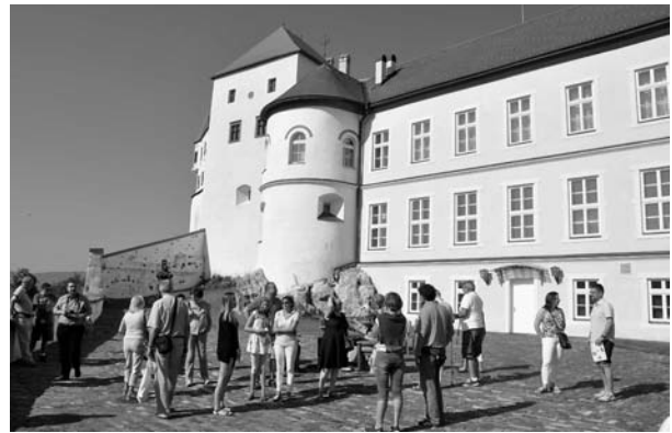
A zólyomlipcsei vár udvarán

Szombaton a Besztercebánya közelében a Garam folyó melletti magaslaton fekvő, a közelmúltban felújított zólyomlipcsei várat tekintettük meg. A középkorban fontos bányaváros Zólyomlipcse neve onnan ered, hogy a Zólyomból Lipcsébe menő fontos középkori út (via magna) mentén fekszik. Városi kiváltságait 1340. november 11-én Károly Róberttől kapta. A 16. századtól a 18. századig a bányakamara