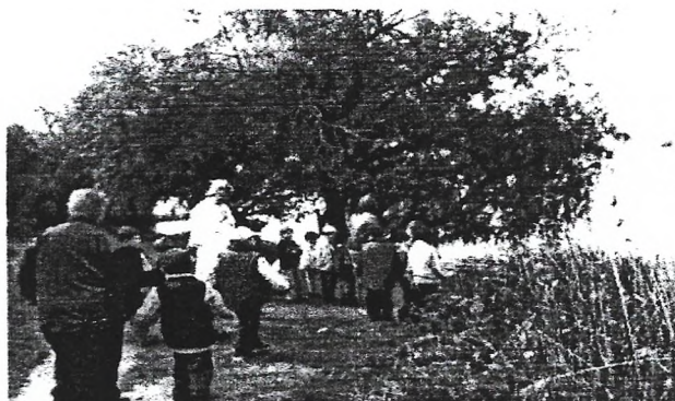
„Madarak és fák napja”