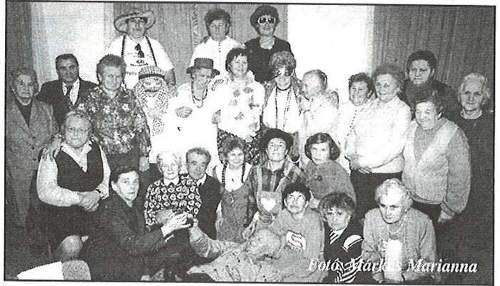
Farsang volt a Nyugdíjas Klubban