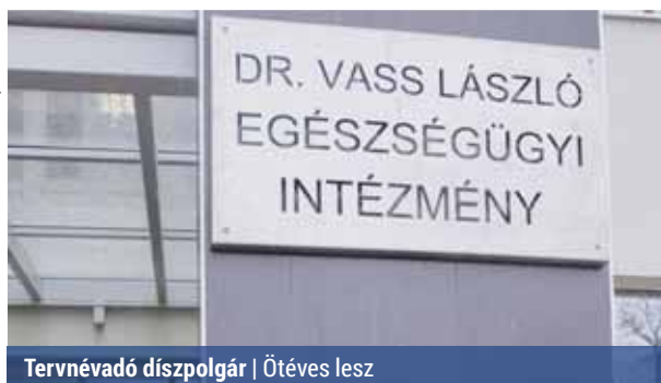
Tervnévadó díszpolgár | Öt éves lesz