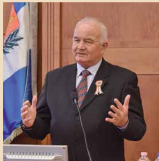
Hajdu László polgármester

rint jó látni nemzeti ünnepeinken, most például az érdemremesek között, hogy eleink méltó utódai tevékenykednek a kerületünkben is, büszkék lehetünk rájuk.