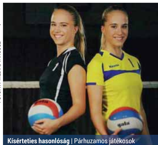
Kísérteties hasonlóság | Párhuzamos játékosok