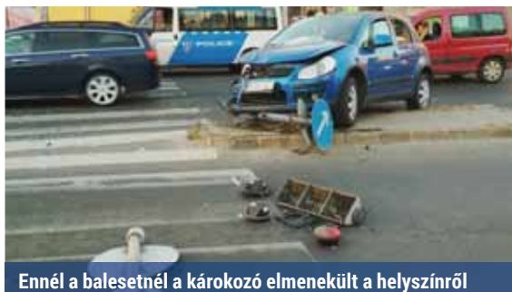
Ennél a balesetnél a károkozó elmenekült a helyszínről

A fővárosban naponta számos kisebb-nagyobb ütközés történik, azonban sokan nem tudják, mi a teendő ilyenkor. Fontos, hogy mindig legyen nálunk betétlap, és ha miénk a felelősség, azt elismerjük.