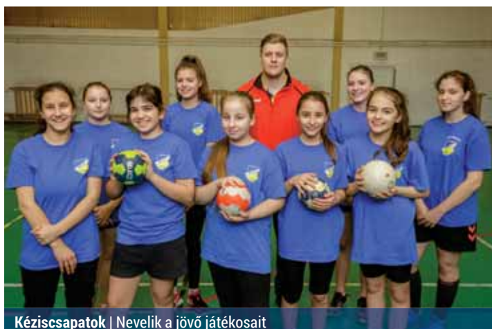
Kéziscapatok | Nevelik a jövő játékosait

A REAC SISE felnőtt női kézilabdacsapata jelenleg az NB II.-ben szerepel. Az ificsapat pedig az ifjúsági III. osztályban játszik. Am,