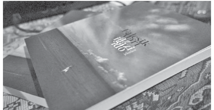
Mari legutóbbi verskötete

Vagy 200 könyvben áll szerkesztőként a nevem, köztük többnek a könyv ötletétől a megjelenéséig voltam alkotószervezője és felelőse. Ebből a listából nehéz volna bármit is kiemelni. De az fontos különbség, hogy én nem szépirodalmi szerkesztő vagyok, hanem tényirodalmi: nem szeretem a mások szépírói műveit szerkeszteni, az megzavarná a magam alkotói