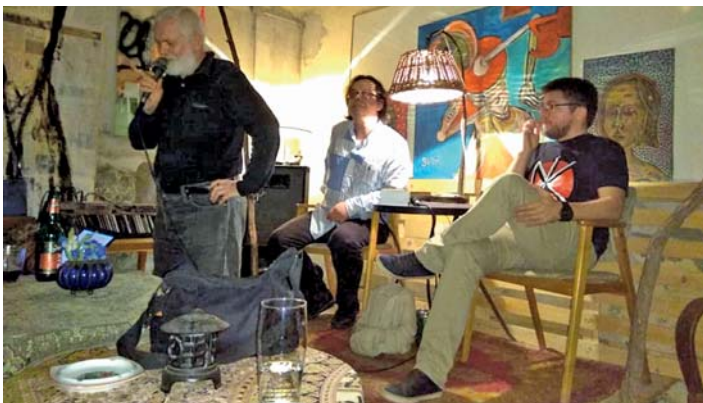
Kezdődik a Mersz-est, fölvezeti Triceps

– Örömmel tettük, és épp most készítjük össze, még nagyobb örömmel, az újabb rakományt, amit ezúttal Édesanyám könyveiből adományozunk a kónyi olvasóknak. Alapítványunk a művészeti-kulturális tevékenységeinket fogja össze: saját szereplésünket a kortárs alkotói szférában, a klub működtetését, fiatal tehetségek gondozását-támogatását, a Mersz Könyvek sorozat 100 példányos illusztrált, kísérleti