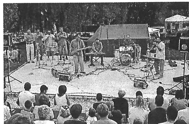
A falunapi rendezvényeken készült digitális képek megtekinthetők és megvásárolhatók a Teleházban.