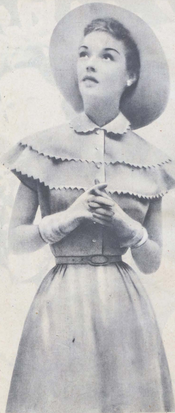
161. Rózsaszín piké vagy vászon ruha, cakkozással díszített keppyszerű gallérral II.

A nyár divatjához tartozik a strand- és fürdőruha. Fürdőruha éppen úgy divatos satenből, mint vászonból vagy kartonból. Míg a saten fürdőruhák rendszerint egybeszabottak, vászonból vagy kar-