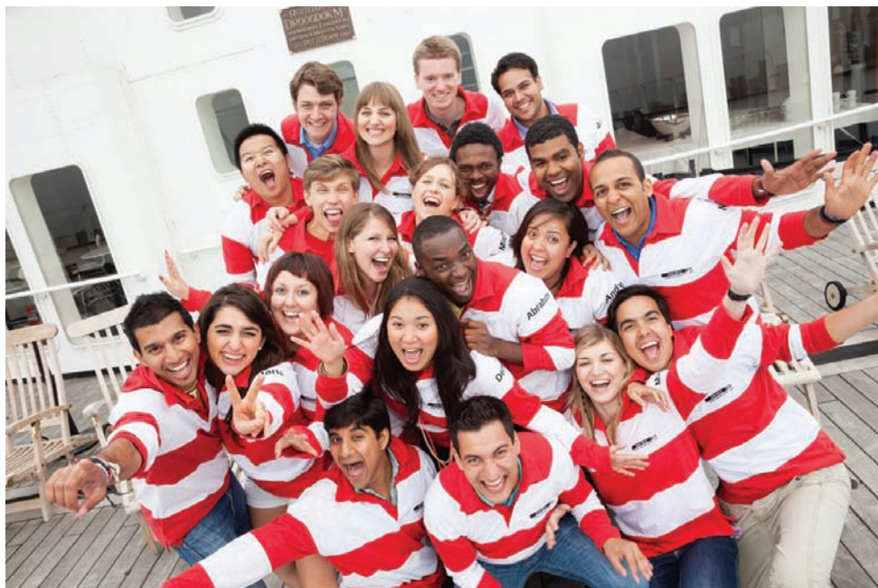
Az AIESEC 2011–12. évi globális vezetőségi csapata

A Day One Capital Kockázati Tőkealap-kezelő befektetési szakértője vagyok, ahol jelenleg kettő, összesen mintegy másfél milliárd forint értékű magvető alapot kezelünk. Abban segítjük a technológia és dizájn területén egyedi innovációval rendelkező vállalkozóinkat, hogy ambiciózus céljaikat megvalósíthassák.