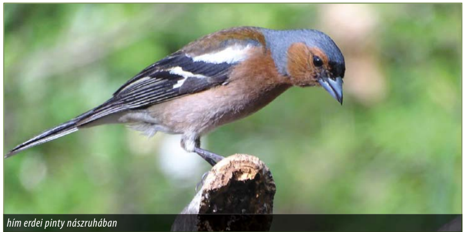
hím erdei pinty nászruhában