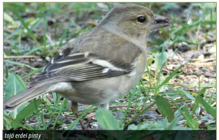
tojó erdei pinty