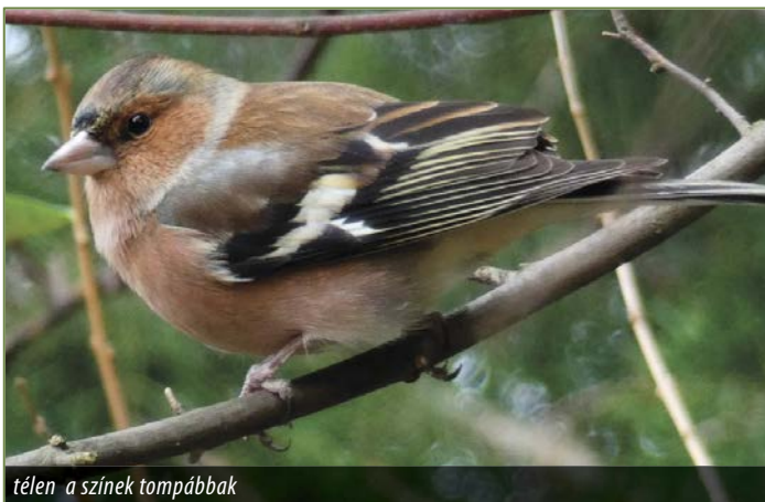
télen a színek tompábbak