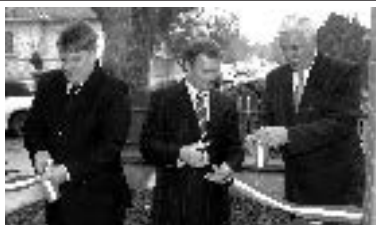
Az átadás pillanata

A Képvisel -testület- a nehéz anyagi körülmények ellenére - úgy döntött, hogy az 50%-on felül felvállalja az épület karbantartását és felújítását is, így biztosítva a helyben történő zeneoktatást városunk legkisebb lakóinak.