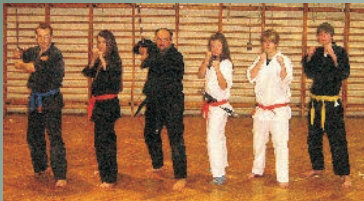
„USE Pilisi Kempo Klub”