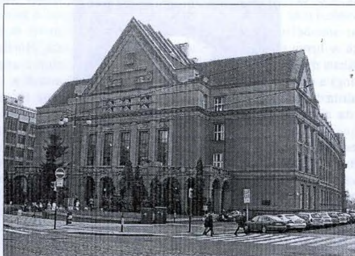
A prágai Károly Egyetem Jogi Kara