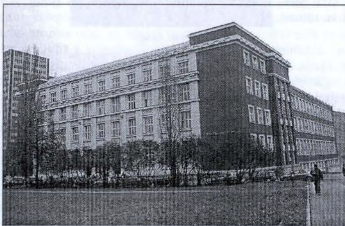
A brnói Masaryk Egyetem Jogi Kara