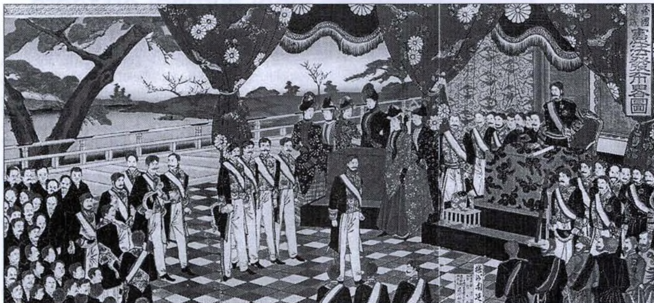
A Meiji-alkotmány kihirdetése (Hashimoto Chikanobu képe)

államformájaként az alkotmányos monarchiát támogatta, amely a szabadság szellemén keresztül erősíti az állam rendjét, és elősegíti a nemzeti erők megerősödését.