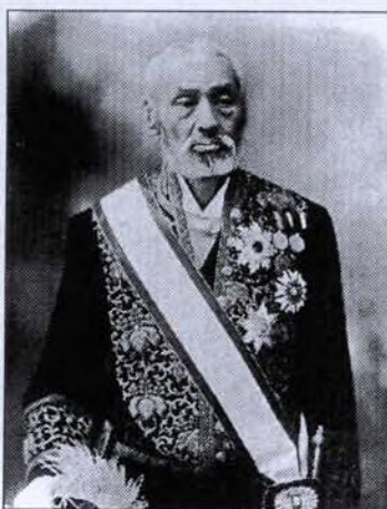
Hiroyuki Kato (1836–1916)

missziót” 5 is az Amerikai Egyesült Államokba és Európába. Ez a misszió körülbelül 100 személyből állt, beleértve a kormány vezető rétegének 46 tagját. Azért,