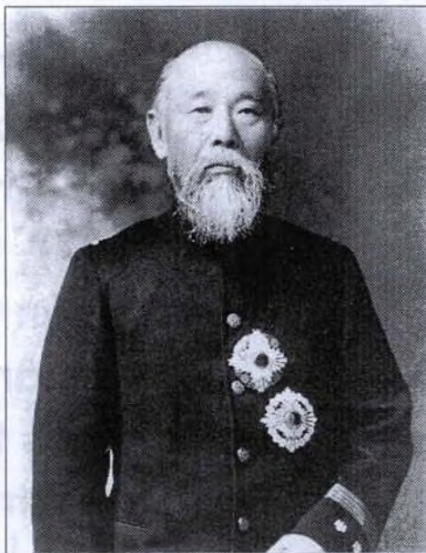
Hirobumi Ito (1841–1909)

Örökletes sógunátusa idején a Tokugava-ház irányította az államigazgatást és a hadügyet. Ugyanakkor a nép mégis a mindenkori tartományuraknak volt alárendelve. Ebben az értelemben az egyes tartományi uradalmak jelentették az államot a nép számára. A jogrendszer legtöbbször a