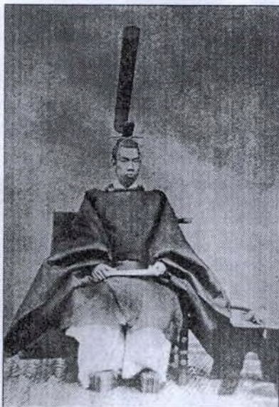
Meiji tenno – A fiatal Meiji-császár (Mutsuhito) 1872-ben

Amikor a Japánban csak „Meiji-restauráció”-nak nevezett időszak elkezdődött, az embereknek még csak elképzelésük sem volt arról, hogyan kell egy államot úgy megszervezni, hogy az európai mércével is modern legyen. Ez magyarázza, hogy miért fordított az akkori japán kormány olyan sok pénzt (mai értéken évente körülbelül 40 000 000 eurót) külföldi tanácsadók meghívására. 4 Ugyanebből az okból küldték az „Iwakura-