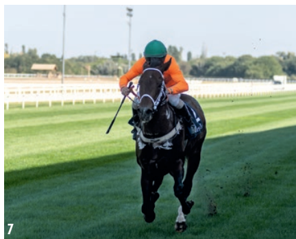
1. Eggi's Choice a jártatóban | 2. Koszorúzás a Kincsem-szobornál | 3. Light Blue Sky nyerte az Imperiál Díjat | 4. Finis az Imperiál Díjban | 5. Díjátadás az Imperiál Díj után | 6. Vain Hope és Marlon | 7. El Prado's Joy

nem tudott küzdelembe kerülni, és a nyolc induló között az ötödik helyet szerezte meg. A Kincsem Díj megnyerésével élete legnagyobb sikerét aratta és eddigi legmagasabb pénzdíját vihette haza. Hogy a sikere mit jelent? Markoni LP versenyben elért 75-ös hendikepszámát látva elmondhatjuk, hogy az elmúlt három év Kincsem Díjai ennél erősebbek voltak, hiszen tavaly Opasan 1,5, két éve Nancho