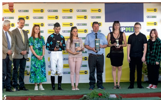
■ 1. Az Overdose-szobrot is megkoszorúzták a díj győztesei | 2. Díjátadás az Overdose Díj után | 3. Elindultak a legjobb magyar háromévesek | 4. Seventy Smile biztosan nyerte a Magyar Háromévesek Nagydíját | 5. Díjátadás a Magyar Háromévesek Nagydíja után

ver Peppert, Light Blue Skyt, az újra formába lendült Levendulát, Dante's Peaket és Báthoryt is. A jó tempóra a két utóbbi gyors ló indulása jelentett garanciát. A verseny a várakozások szerint indult, azonban a teljes mezőny közel haladt egymáshoz. A célegyenesbe fordulva Báthory és Dante's Peak elfáradt, miközben a kanyarban nagyot botlott Ocasio Cortez, és Light Blue Sky (GB, 3pk, Adaay