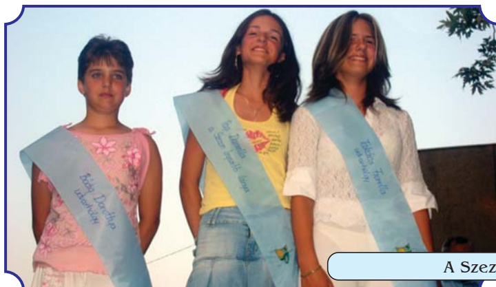
A Szezon Szépei