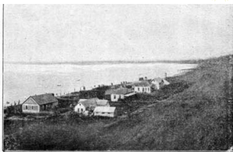
Világos: A telep alsó része. 1902 körül