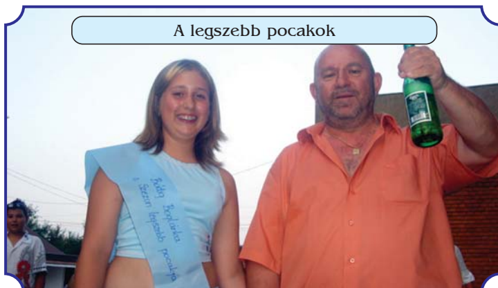
A legszebb pocakok