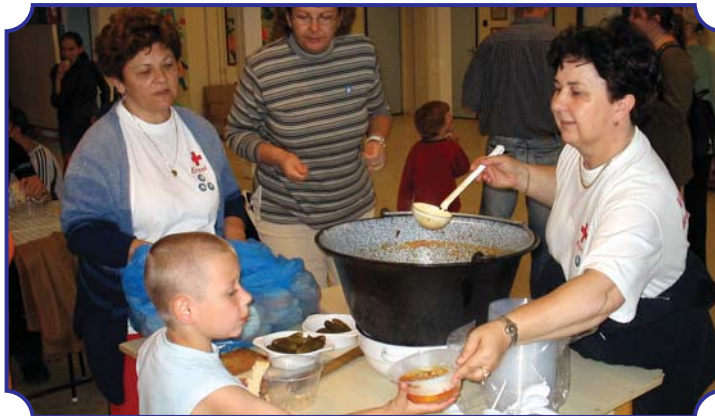
Kitűnő volt a vendéglátás