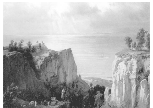
Molnár József: Aligai szakadék 1885 körül