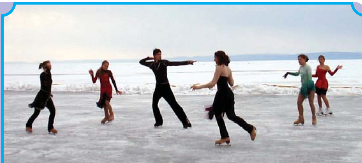
... és így indulhat a jégtánc-kavalkád...