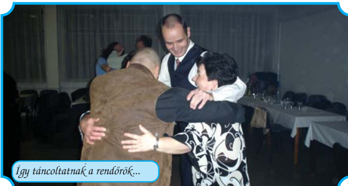
Így táncoltatnák a rendőrök...