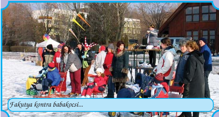
Fakútya kontra babakocsi...