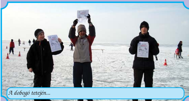
A dobogó tetején...