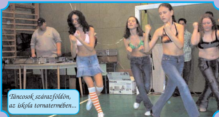
Táncosok szárazföldön, az iskola tornatermében...