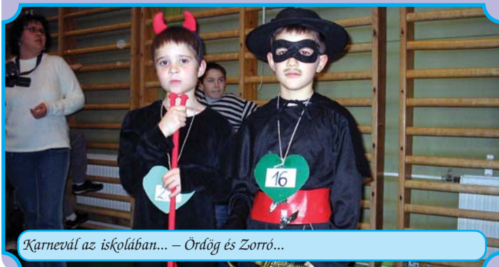
Karnevál az iskolában... – Ördög és Zorró...