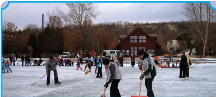
Lelkes önkéntesek takarítják a pályát...