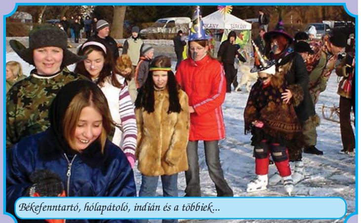
Békefenntartó, hólapátoló, indián és a többiek...

Az általános iskolások nevében köszönjük a felajánlásokat, melyek hozzájárultak az iskolai farsang sikeréhez! A rendezvény bevételét a gyerekek egy szabadidős programjára fordítjuk! Köszönjük!