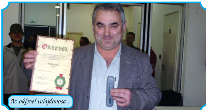
Az oklevél tulajdonosa...