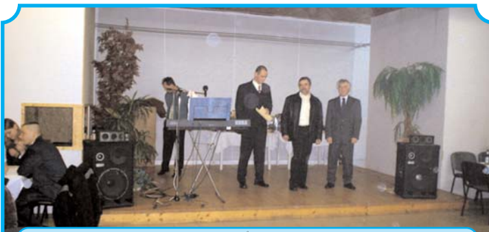
A balatonkenesei rendőrőrs parancsnoka és az alpolgármester nyitották meg a bált