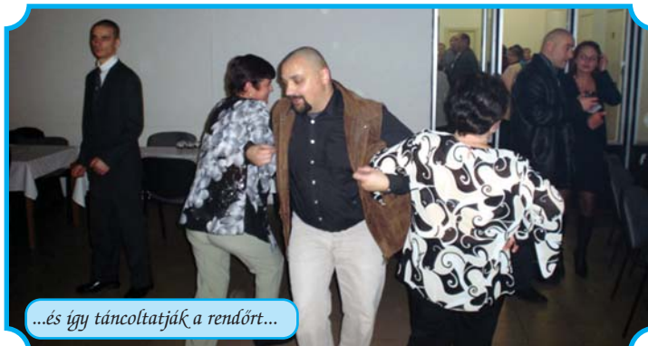
...és így táncoltatják a rendőrt...

I dén is megrendezésre került a hagyományos jótékonyági polgárőrbál. Az önkéntes csapatnak ez az egyetlen lehetősége a pénzszerzésre. Szerencsére a sok jóindulatú támogatónak illetve a sok szórakozni vágyónak köszönhetően sikerrel zárhattuk az idei báli szezont. A belépőkből és a tombolaárusításból befolyt bevételt benzinre fogjuk fordítani. A lap hasábjain keresztül mondunk köszönetet mindazoknak, akik eljöttek, reméljük, jól érezték magukat. Köszönetet mondunk mindazoknak, akik