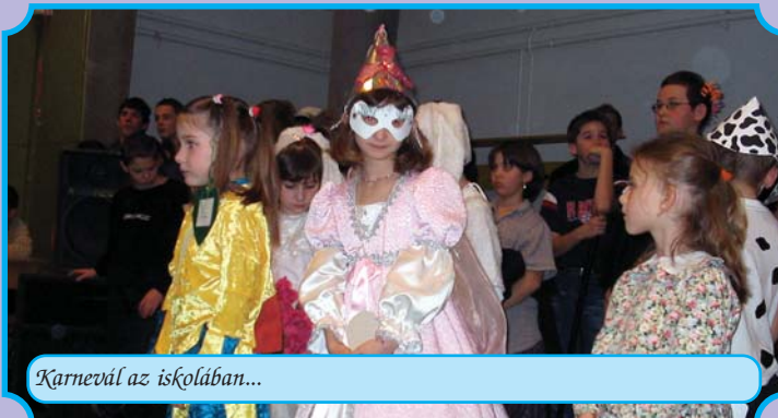
Karnevál az iskolában...