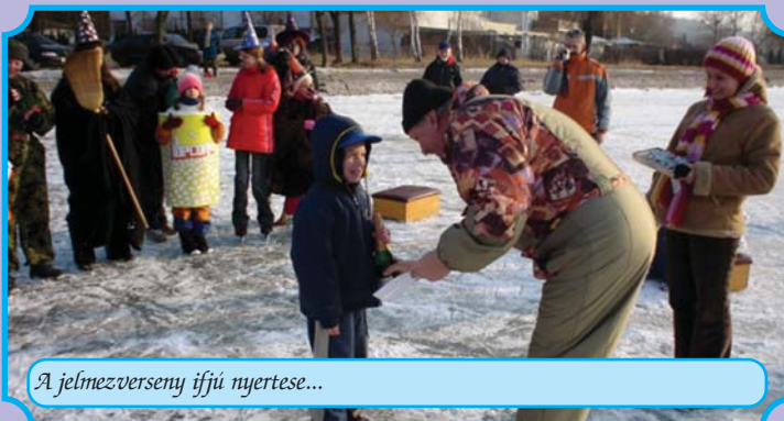
A jelmeztverseny ifjú nyertese...