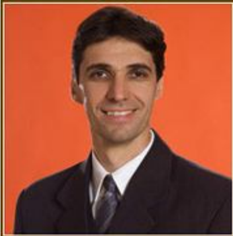
Bakó István polgármester

- Bakó István, Derecske város polgármestere miként vélekedik arról hogy a hegyközcsatáriak meglepődve tapasztalták azt a számukra különleges bánásmódot, szeretetet, amellyel a hivatal munkatársai fogadták a külhoni testvérek honosítási kérelmeiket.