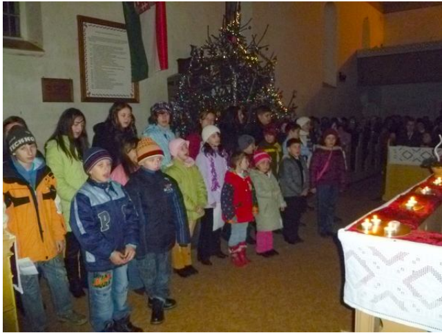
A GYERTYAFÉNYNÉL FELCENDÜLT A „CSENDES ÉJ... NÉPSZERŰ KARÁCSONYI ÉNEK