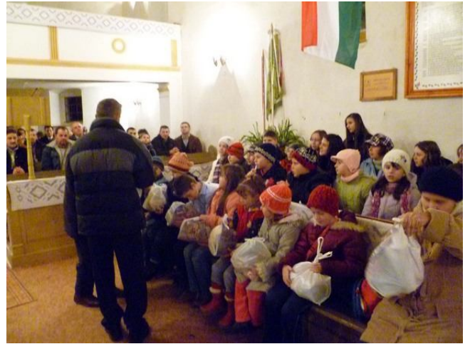
A GYEREKEK ÖRÜLTEK AZ AJÁNDÉKOKNAK

A Polgármesteri Hivatal és a nagyváradi Teréz Anya alapítvány jóvoltából Mikulás csomagokat osztottak a község óvodáiban, amelynek nagyon örültek a gyerekek.