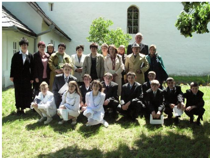
EGYÜTT A LEGIDŐSEBB ÉS A LEGFIATALABB KONFIRMÁNDUS A SÍTERI TEMPLOM KERTBEN

A szép idő és kedvező időjárás közepette tartották meg a templomkertben a szeretetvendégséget, amelyen részt vettek mindazok, akik Pünkösöd első napján ott voltak az Istentiszteleten és a megemlékező rendezvényen.