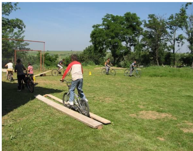
BICIKLI ÜGYESSÉGI VERSENY AZ ISKOLA UDVARÁN KIÉPÍTETT PÁLYÁN