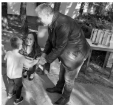
Víz Világnapi díjátadó