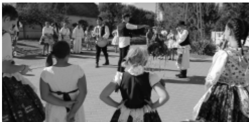
Szüreti felvonulás és bál 2022.