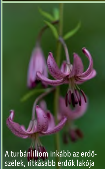
A turbánliliom inkább az erdőszélek, ritkásabb erdők lakója