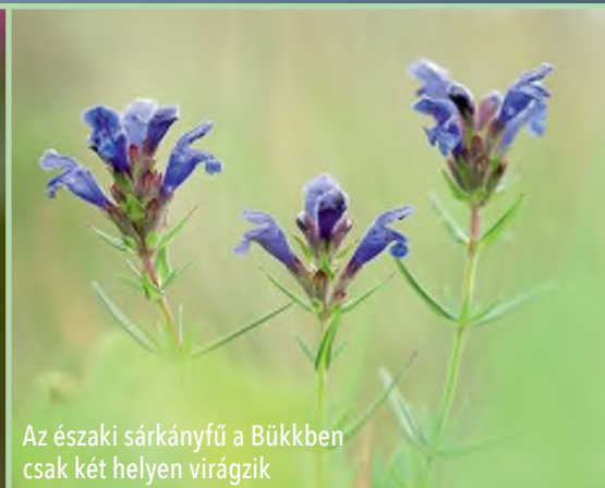
Az északi sárkányfű a Bükkben csak két helyen virágzik