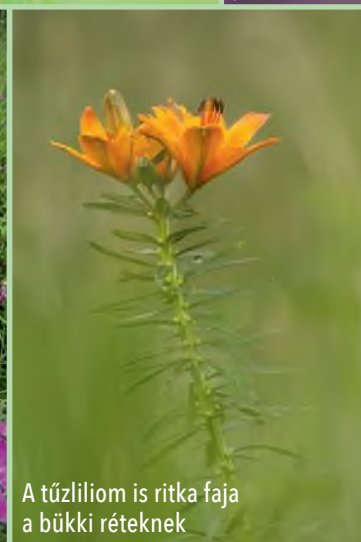
A tűzliliom is ritka faja a bükki réteknak