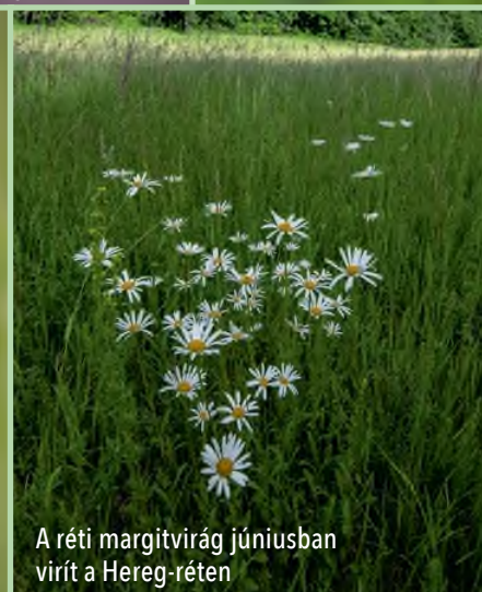
A réti margitvirág júniusban virít a Hereg-réten