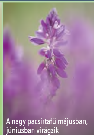
A nagy pacsirtafű májusban, júniusban virágzik