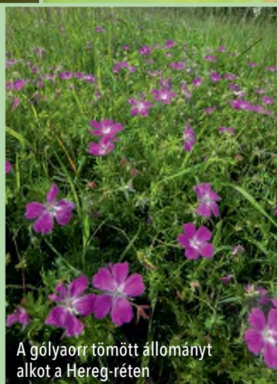
A gólyaorr tömött állományt alkot a Hereg-réten