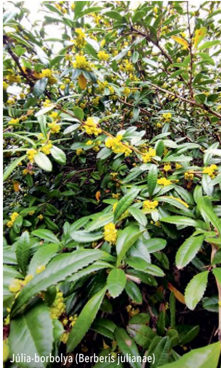
Júlia-borbolya ( Berberis julianae )

De jó nekik! Most ők a „világutazók”, mi úgysem voltunk sehol. Szeretem én így is, csak most sokkal több várankozással van tele a lelkem, ezért, ha kicsit megkésve, fázósan is, de napról napra több étellel telik meg a kertem. Van mit szeretni így is. Most megmutatok ebből néhány apró csodát.