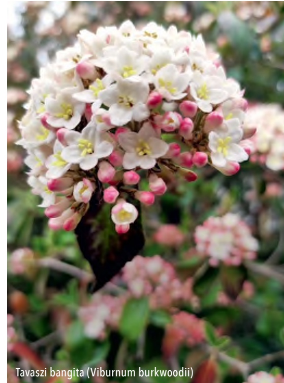
Tavaszi bangita ( Viburnum burkwoodii )

A ki valami erős fűszeres illatra vágyik, feltétlenül ültessen egy Júlia-borbolyát ( Berberis julianae ). Ez alpnövény, de nagyon elfeledett, igazán méltatlanul hátrасorolt a mai kertkultúrában. Az én borbolyámnak története van: talán a második vagy harmadik kertet építettük, amikor a kert gazdája így szólt, azt a növényt csak dobják ki, semmirevaló. Látam, nincsen értelme erről vitát nyitni, de már tudtam, a még éppen alakuló kertembe érkezik két tő korosnak mondható, hibátlan formájú „Júlia”. Már akkor is lehettek vagy hat-nyolc évesek az 50-60 cm-es átmérőjű, sűrű örökzöld bokrok. Azóta már huszonnyolcadik évüket töltik a kertemben. Kétévente kapnak egy kis formázást, mára már 2-2,5 méter átmérőjűre cseperedtek. Egyetlen ellenérv, amit fontolóra kell vennie annak, aki barátságot kötne ezzel a „lánnyal”, hogy eléggé védekező típus: irgalmatlanul szúrós töviseket fejleszt, de még a fogazott levelei is könnyen okoznak sérülést. Ettől eltekintve egyszerűen nevelhető növény. Ezek az idős példányok védelmet biztosítanak jó néhány rigófiókának is. Madárbarát költőhely, hiszen még a macska is elkerüli. Télen apró hamvaskék bogyói is kiváló csemegéi az éhező szárnyasoknak.