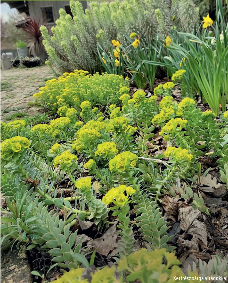
Kertrész sárga virágokkal

Nincs olyan év, hogy az utcán sétálók, kerékpározók közül ne kérdezze meg néhány ember, hogy mi a neve, hol szerezhető be, hogyan nevelhető.