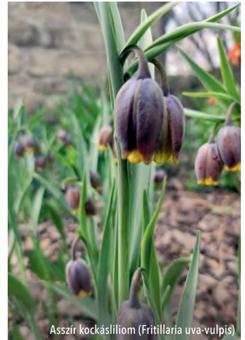
Asszír kockásliliom ( Fritillaria uva-vulpis )

Van egy kertrész, ahol most csak sárga virágok virítanak, ezt a látványt a konyhából élvezzük a kisházzal a háttérben. Most a főszerep a kutyatejeké, a délszaki kutyatej ( Euphorbia myrsinites ), a velencei kutyatej ( Euphorbia characias subsp. wulfenii ) és a hegyi ternye ( Alyssum montanum 'Berggold' ) napsárga virágtömege hoz mosolyt az arcunkra. Akárki akármit mond, én szeretem a sárgát, belegendolva, elég sok sárga virágú évelőt, hagymást ültettünk a kertbe. Ebbe az ágyásba még bekerült vagy harminc asszír kockásliliom ( Fritillaria uva-vulpis ) is. Imádnivalóak, virágfürtjeik barnásvörösek, sárga szegéllyel. Április–májusban