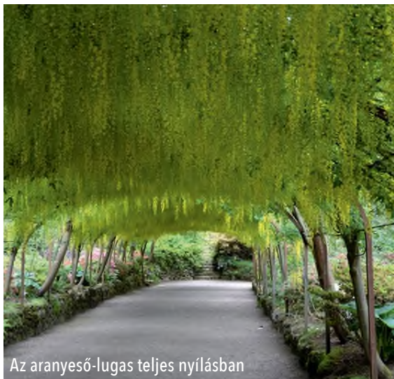
Az aranyeső-lugas teljes nyílásban

a tulajdonos család gondosan megtervezett, növényzettel körülöleltetett valamikori fürdőmedencéjét. Végül, aki májusban látogatja meg a kertet, végigsétálhat az éppen nyíló, felejthetetlen élményt adó aranyeső-lugas alatt. Ez egy egyedülállóan látványos, 55 méter hosszú ívelt pergola, amely mellett 48 fő közönséges aranyesőt ( Laburnum anagyroides ) ültettek el. A virágzatok sárga zuhatagként csüngenek alá.