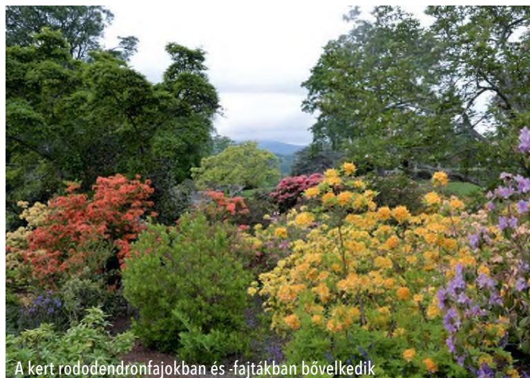
A kert rododendronfajokban és -fajtákban bővelkedik