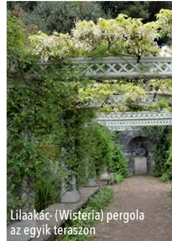
Lilaakác- (Wisteria) pergola az egyik teraszon

ban tűgyárnak épült Gloucester grófságban, Lord Henry megvásárolta, lebontatta, majd tégláról téglára összerakatta kertjében 1936-ban. Az itt induló liliomfa-sétányon (Magnolia Walk) leereszkedhetünk a Hiraethlyn folyócskához, amelynek partján, máig eredeti berendezésével áll az 1830 tájt épült Öreg-malom (Old Mill). Mögötte a Kemence-domb (Furnace Hill) lejtője húzódik változatos idős fákkal és cserjékkel. Innen a Liget-völgyön (The Dell) pompás faóriások alatt, rododendron- és kaméliabokrok, ritka növények mellett továbbhaladva érjük el a szép kilátást biztosító Vízeshíd (Waterfall Bridge). A hídnál áll cserje-borderágyakkal övezve a