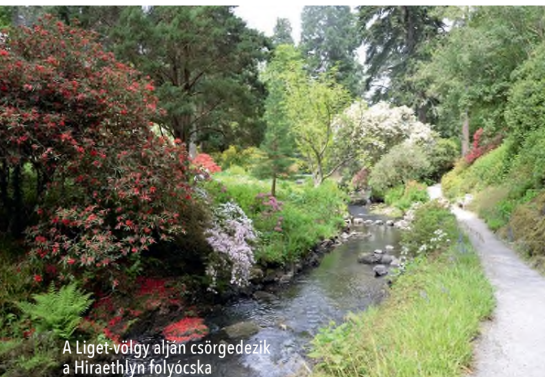
A Liget-völgy alján csörgedezik a Hiraethlyn folyócska

A közeli tenger csökkenti a fagyveszélyt, csak mintegy 10-20 reggeli fagyos nap van, viszont a nyári hőmérsékleti csúcsok is csak 20 °C körül alakulnak. Ezek a környezeti viszonyok emberi szemszögből lehetnek kellemetlenek, de sok egzotikus növényfajnak nagyon is megfelelnek.