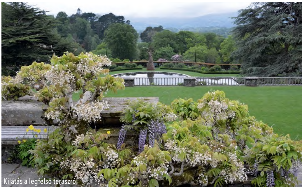
Kilátás a legfelső teraszról