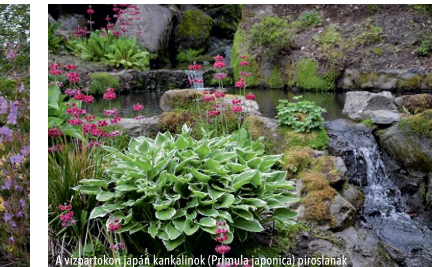
A vízpartokon japán kankalinok ( Primula japonica ) pirosanak