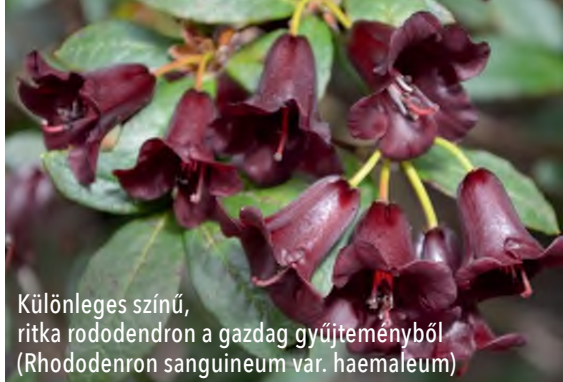
Különleges színű, ritka rododendron a gazdag gyűjteményből (Rhododendron sanguineum var. haemaleum)