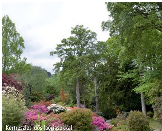
Kertrészlet idős faóriásokkal