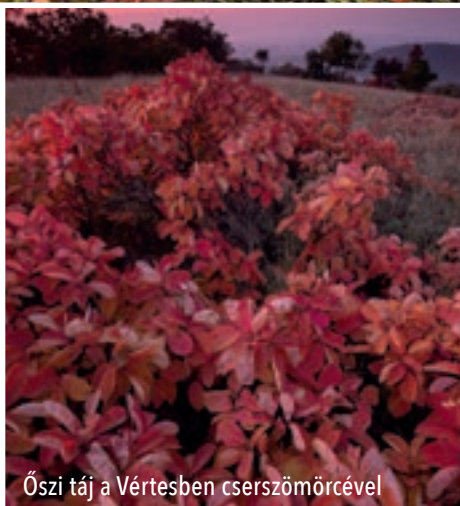
Őszi táj a Vértesben cserszömörccel