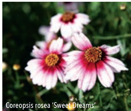
Coreopsis rosea 'Sweet Dreams'