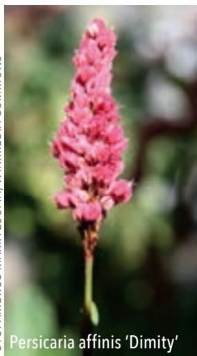
Persicaria affinis 'Dimity'