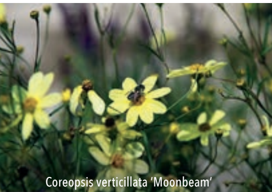
Coreopsis verticillata 'Moonbeam'