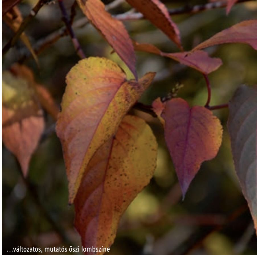
...változatos, mutatós őszi lombszínre