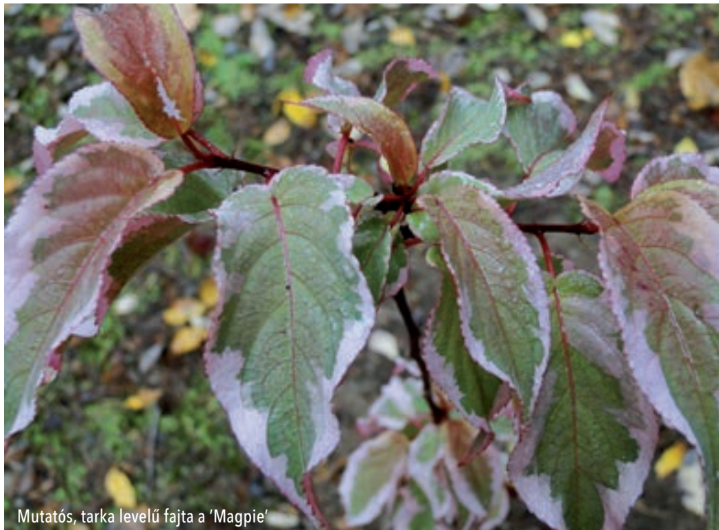
Mutatós, tarka levelű fajta a 'Magpie'

Idehaza még nem sok árudában kaphatók zászlócserjék, Nyugat-Európában azonban több kerti változatukat is szelektálták, amelyek levél- vagy virágszínben térnek el az alapfajtól. Különösen népszerű és elterjedt a közönséges zászlócserje 'Magpie' (szarka) nevű fajtája, amelynek gyönyörű