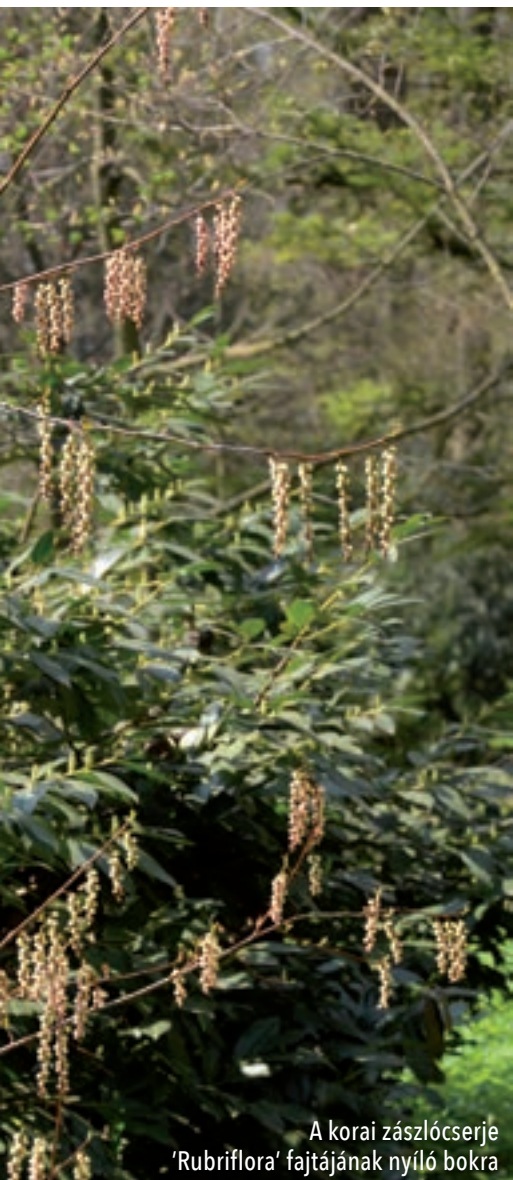
A korai zászlócserje 'Rubriflora' fajtájának nyíló bokra