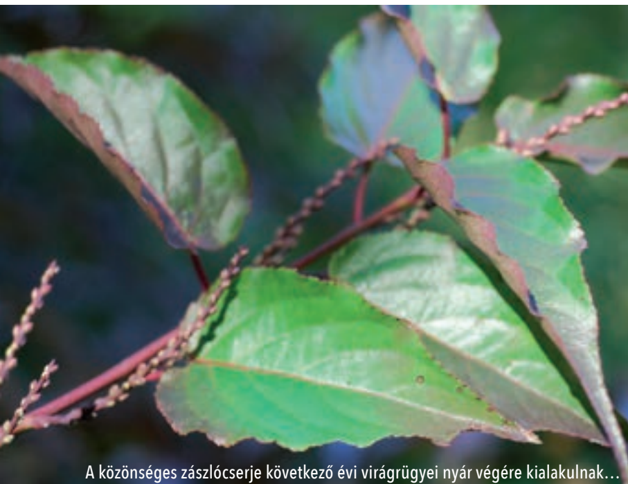
A közönséges zászlócserje következő évi virágrügyei nyár végére kialakulnak...