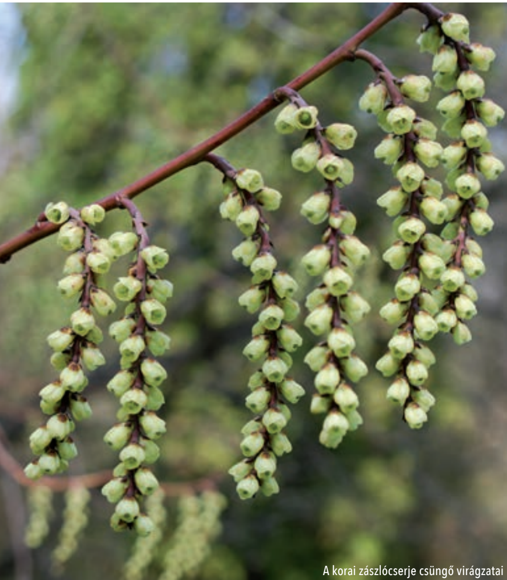
A korai zászlócserje csüngő virágzatai