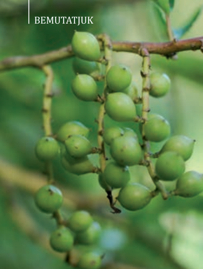
A közönséges zászlócserje kifejlődött termései, és...