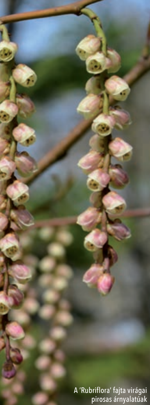
A 'Rubriflora' fajta virágai pirosas árnyalatúak