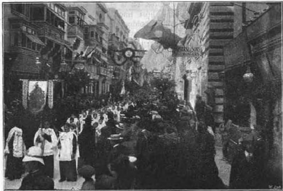
A 9000 áldozó gyermek körmenete Maltában.

V AN TÉRKÉPED, kicsinyem? Keresd meg rajta Olaszországot és ujjaddal utazzál le Afrika felé. Útközben ott találsz a tenger közepén egy kis szigetet, melynek Malta a neve. Ez a hősök szigete. Hatalmas kőfalakkal és óriási bástyákkal van körülvéve. A bástyafokokról félelmetes nagy ágyúk bámulnak ki a tengerre. Minden talpalatnyi földjét hősök