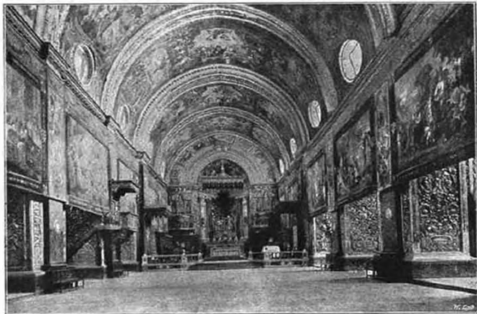
A maltaí Szent János katedrális remek belseje.

Tizenkétezer ember fér el benne. Mindjárt a megnyitón Norfolk