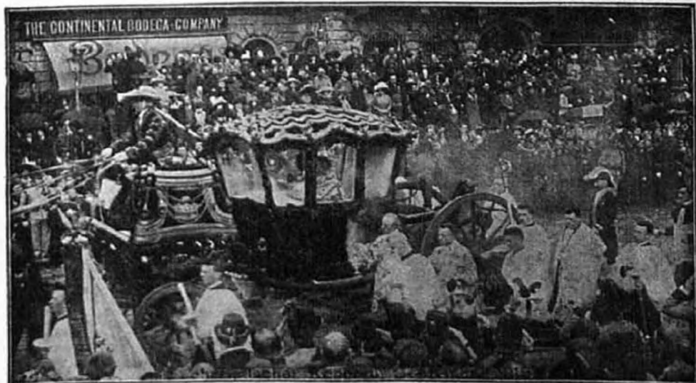
Az Oltáriszentség kocsija a bécsi kongresszuson.

Négy ezüst szenteltvíztartó. Egy aranyból való kristálynyelű szentelt-