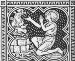
ECCE AGNUS DEI