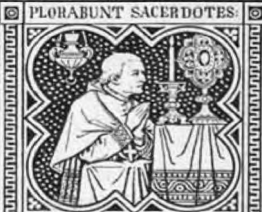
PARCE POPULO TUO.