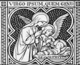
IT DEUM ADORAVIT.