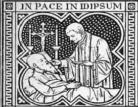
DORMIAM ET REQUIESCAM