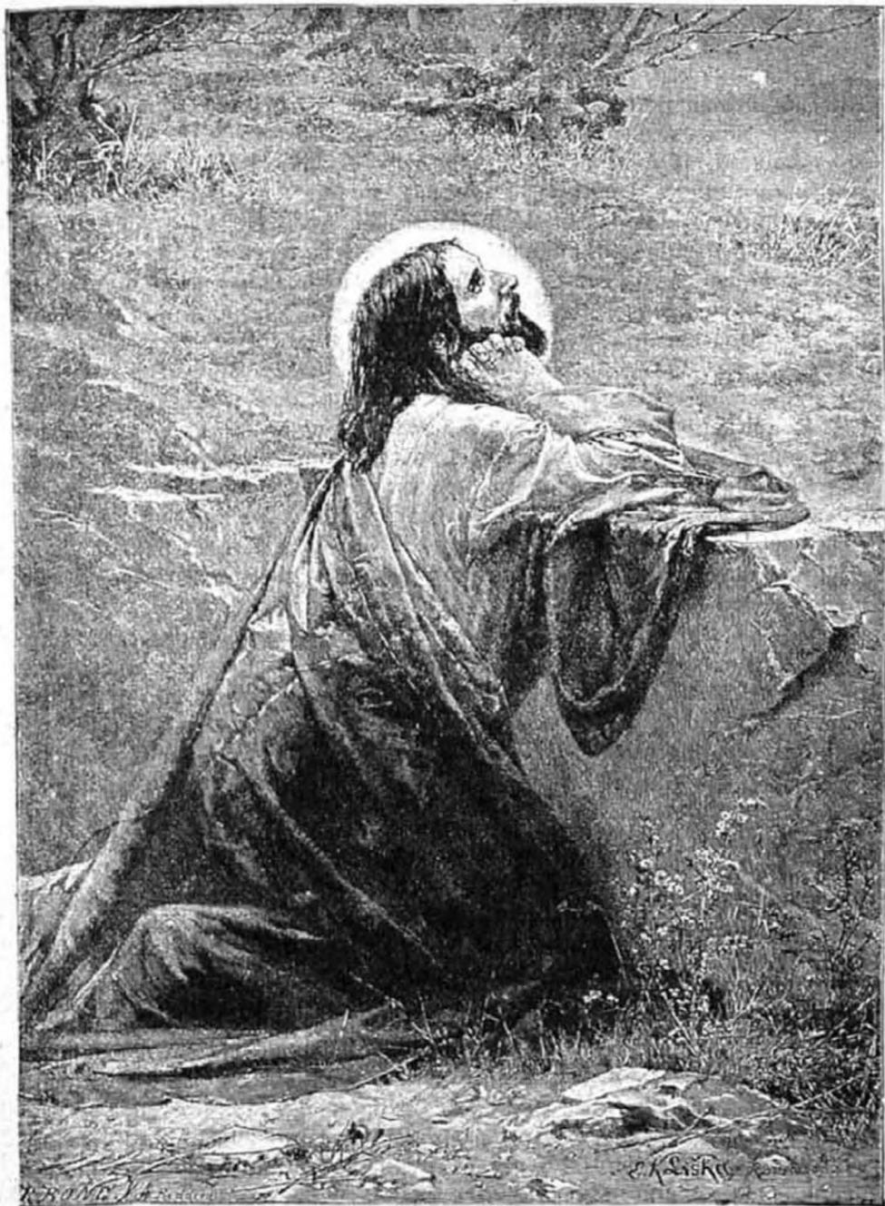
A küzködő Jézus.