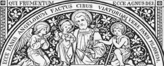
ELECTORUM CONSERVASTI CUJUS NON SUM DIGNUS...

XIII. ÉVF. 1912. 3. SZÁM. ÖRÖKIMÁDÁS HAVI FOLYÓIRAT A LEGMÉLT. OLTÁRISZENTSÉG IMÁDÁSA S SZEGÉNY TEMPLOMOK FELSZERELÉSÉNEK ELŐSEGÍTÉSÉRE HIVATALOS KÖZLÖNYŰL KIADJA AZ ORSZÁGOS OLTÁREGYESÜLET Szerkesztőség-kiadóhivatal Bpest, Üllői-út 77. Ára egy évre 3 korona. Megjelenik minden hó elsején. Stephanum nyomda r. t.