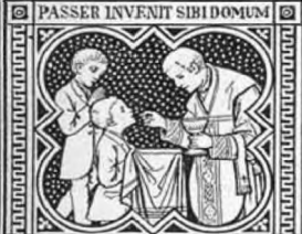
ETTURTUR NIDUM ALTARIA.