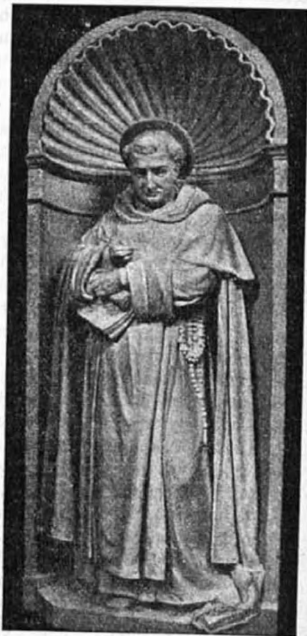
Aquinói szent Tamás.

Joggal mondhatjuk tehát, hogy az Úrnap szent Tamás ünnepe.