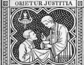
ET ABUNDANTIA PACIS.