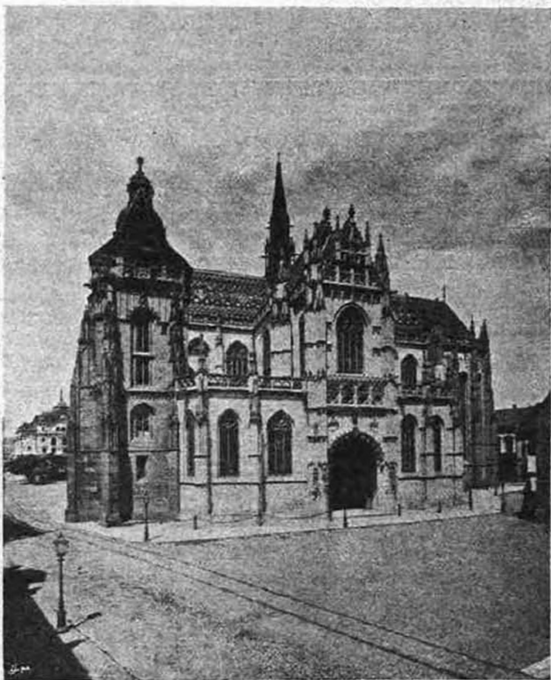
A kassai székesegyház.

azoknak mellőzésére. Lelkiismeretességére nézve elég fölemlitenünk, hogy a bőjtöket még terhes utazásai közben is megtartotta. De nemcsak a maga lelkiüdvösségéről gondoskodott, hanem a katonáéiról is. 1705 december 11-én kiadott rendeletében megparancsolja, hogy minden ezrednek legyen rendes tábori lelkésze, «hogy az isteni tiszteletnek kinek-kinek hitvallása szerint való folyamatja hadaink között is megszűnés nélkül gyakoroltatván, a minden jóra való hasznos kegyesség vitézlő rendeink között is lábra hághasson... s az Uristent hozzánk való könyörületességre engesztelhessük». Az országgyűléseken felszínre kerülő vallási ügyek tárgyalásánál is mindig ugy szerepelt, mint a katholicizmus jogainak harczosa és védője. Életének második felében már valóságos szerzetesi