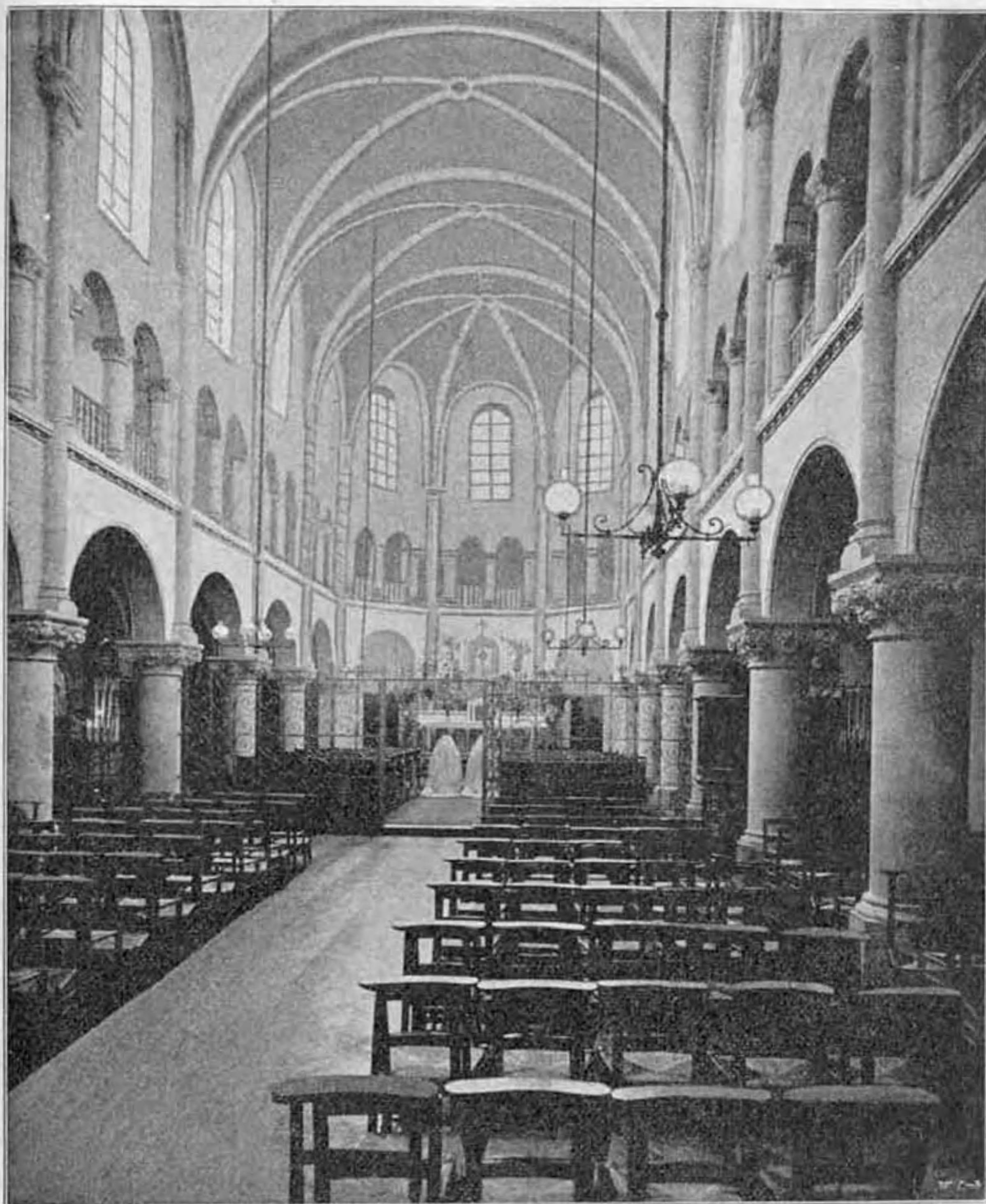
A Mária-Reparatrix-apácák párisi örökimádási temploma.

Illő volt, hogy ha már Rómában működött, működését Jeruzsálemre is kiterjessze. Róma kétségkívül szent város, de nem ép olyan szent-e Jeruzsálem, az a város, melynek falai között a megváltás és az isteni