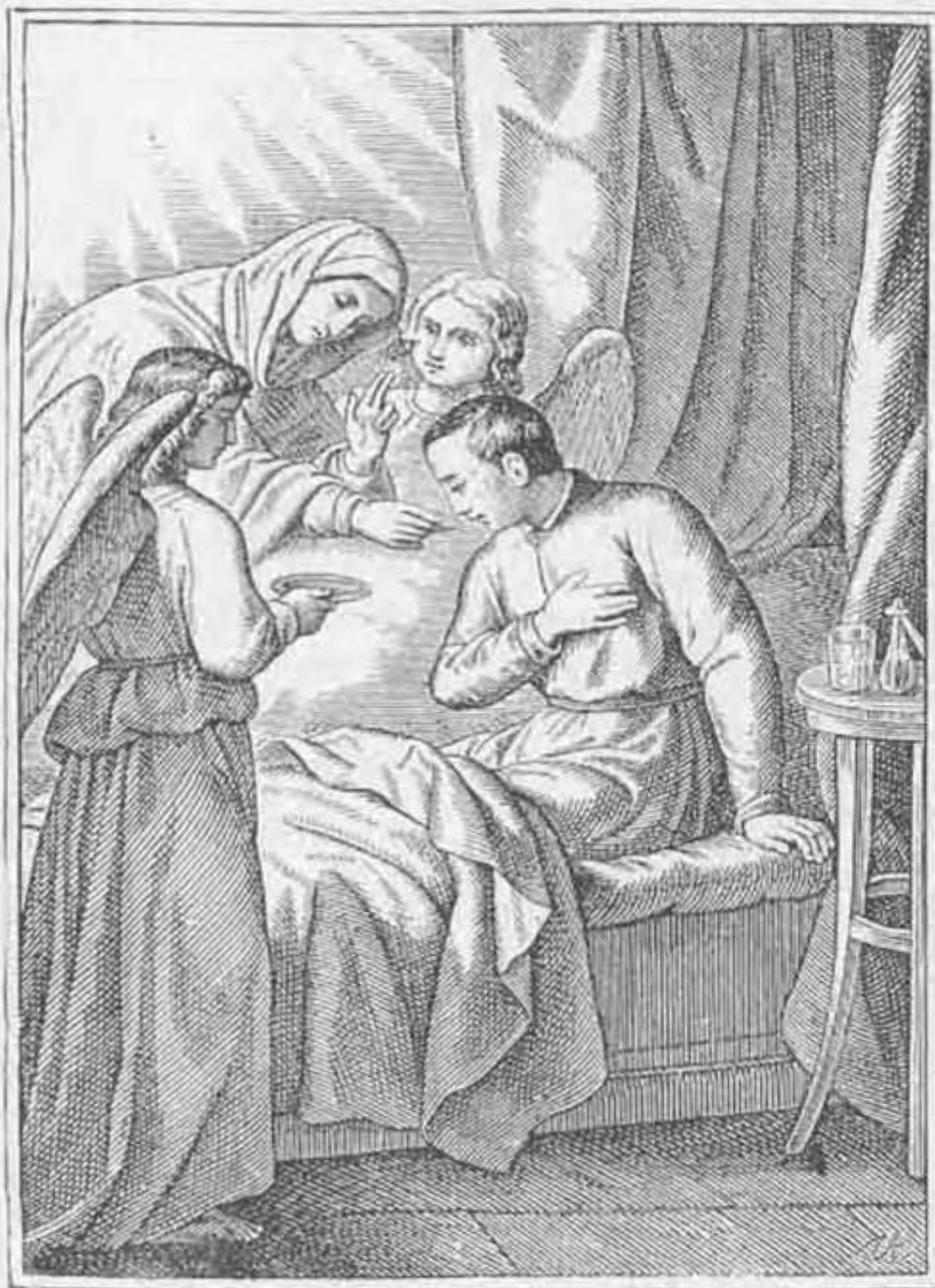
Szent Szaniszló csodálatos áldozása.

Ha ellenkeznének, utaljunk arra, hogy mindenkivel nem fog Isten