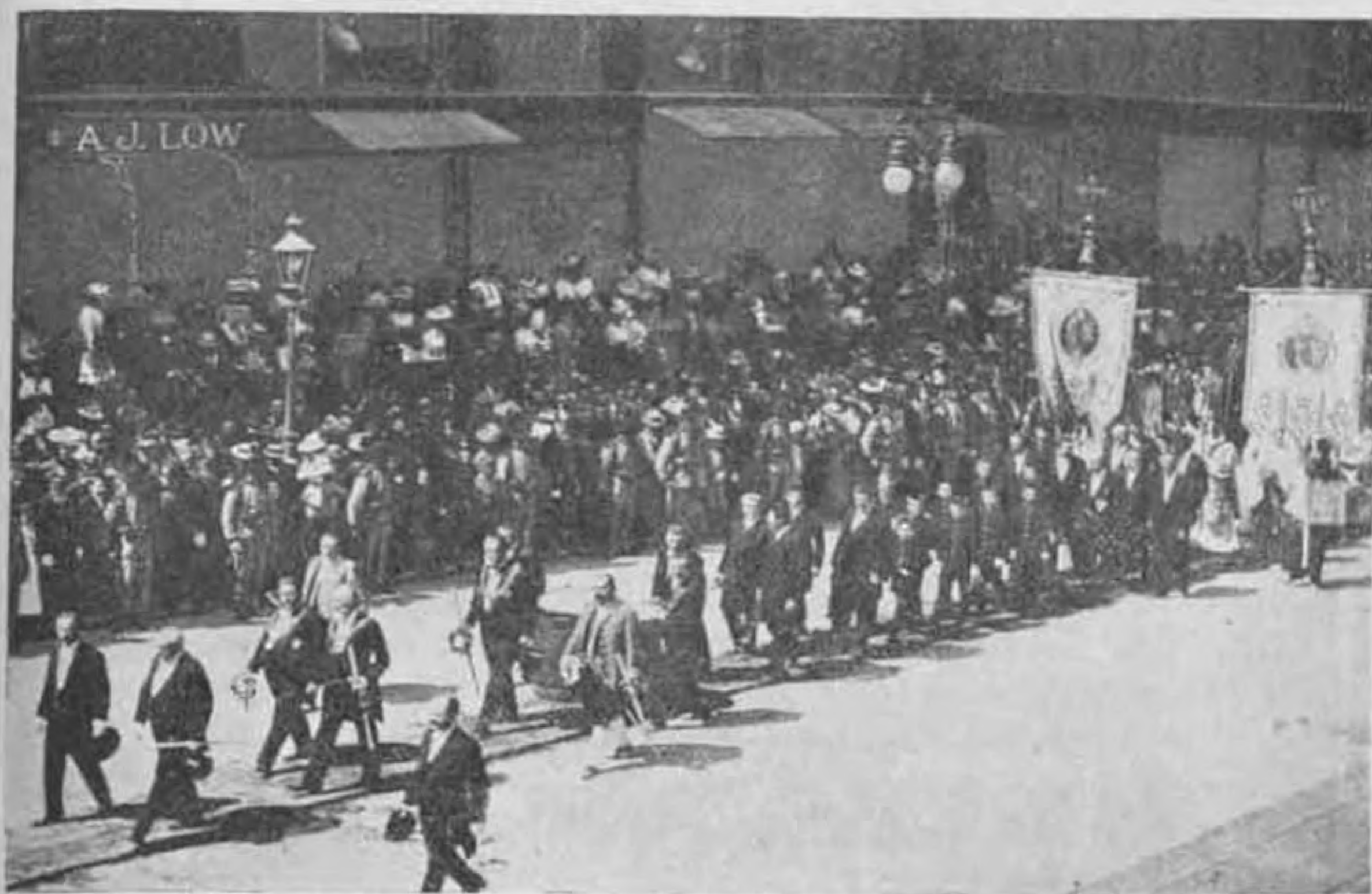
Részlet az urnapi körmenetből Bécsben.