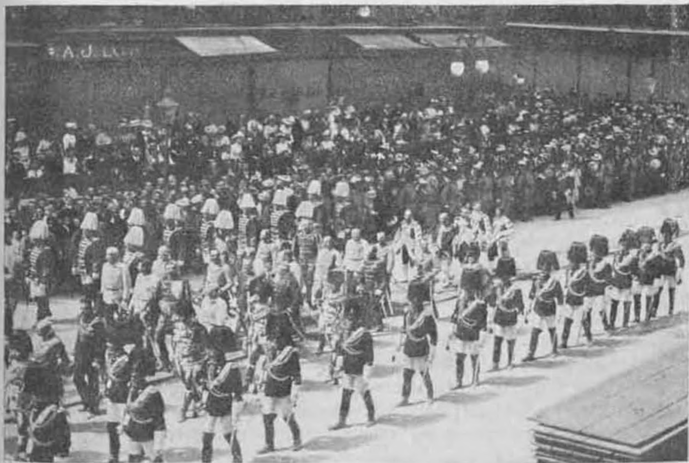
Részlet az urnapi körmenetből Bécsben.