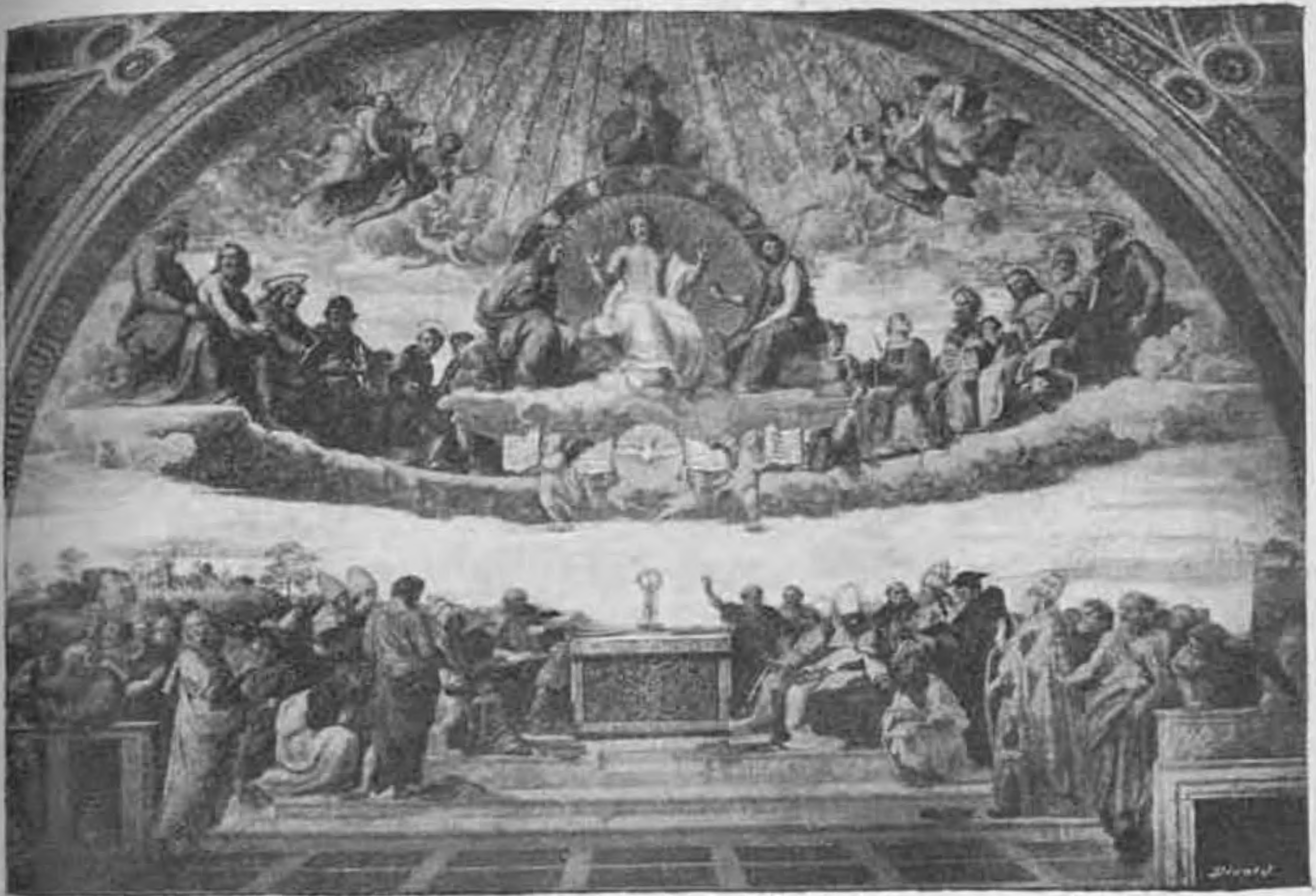
Rafael : Disputa.

körül nyugalmat, békét talál minden földi vándor, a hatalmas uralkodó ugy, mint a szegény napszámos, a dicsőséges pápa ép ugy, mint az utolsó jámbor hívő, s akár csak a mennyei Krisztus körül csoportosuló megdicsőült lelkek, békét s benne boldogságot találnak mindannyian.