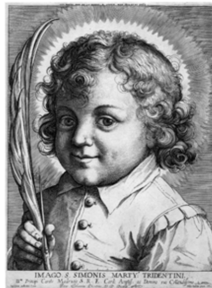
Pietro Stefanoni: Trienti Simon

kezdve a zsidókat. A kis Simon helyi szentté vált (bár hivatalosan soha sem kanonizálták); „rituális meggyilkolását” sok ábrázoláson a Judensau (zsidódisznó) ábrázolástípussal együtt láthatjuk. (Trenti Simon történetét a 21. században is a vérvád terjesztésére használják: még honlapot is készítettek az emlékére).