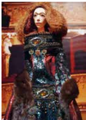
Bánk Bán, Gertrudisz báb