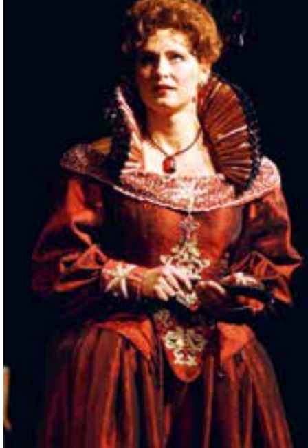
Don Carlos, Erzsébet