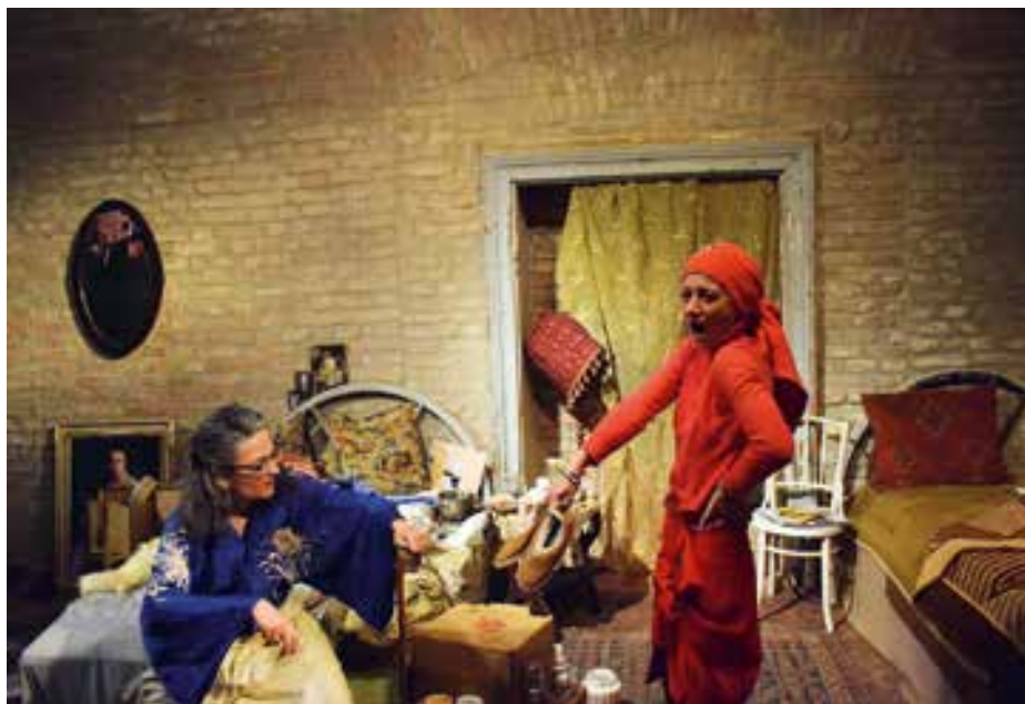
Szőrke kertek, RS9 színház