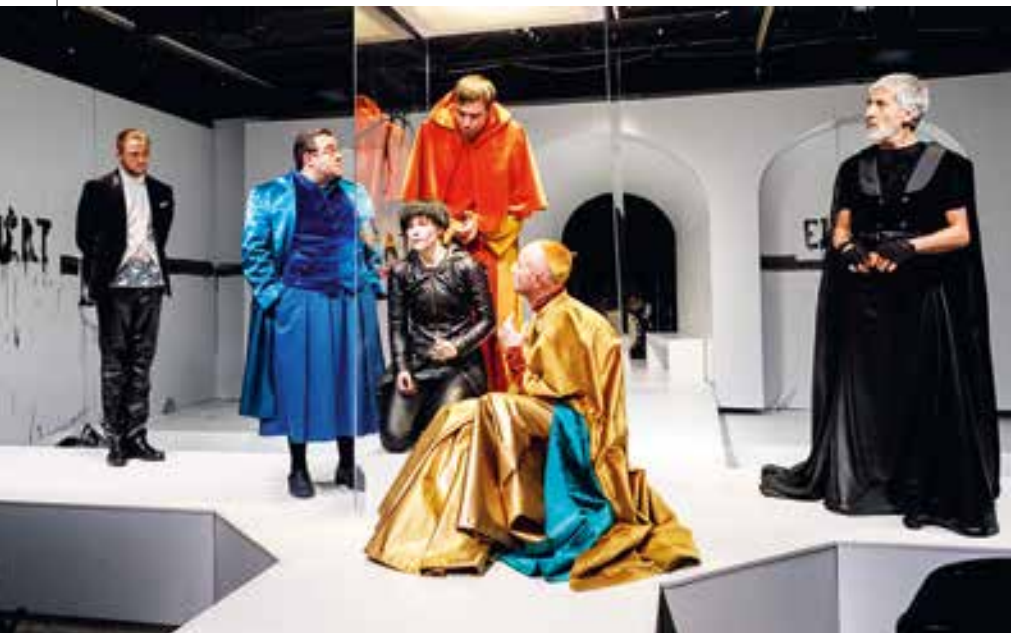
Jeanne d'Arc, Katona József Színház

rája rengeteget hozzátett a nézői és az alkotói élményhez is, de igazi kihívás volt a megvalósítás szempontjából. Lehet, hogy egyszerűnek tűnhet a díszlet. Ez csak egy medence vízzel megtöltve. Ezt minden próbára és előadásra tűzoltóautó hozta a bázisra, és minden alkalommal újra kellett tölteni, melegíteni és kiszivattyúzni. A díszletelemek helyben készültek el. A színészek is beálltak festeni. Ez valódi csapatmunka és próbatétel, hogy ilyen nehézségek között is jó alkotótársak vagyunk-e. Az elmúlt években sokszor dolgoztunk együtt.