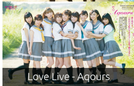
Love Live - Aqours