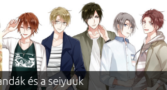
TsukiPro bandák és a seiyuuk