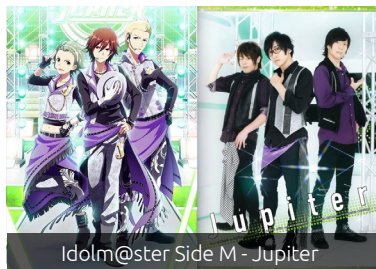
Idolmaster Side M - Jupiter