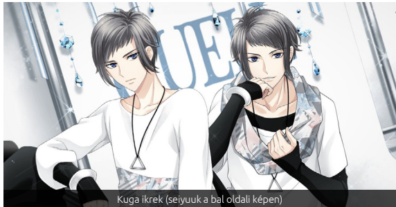
Kuga ikrek (seiyuuk a bal oldali képen)

a SolidS vezetője és producere is egyben, aki a benne rejlő szenvedélyt hűvös viselkedéssel palástolja. Ő már a SolidS megalakulása előtt is idolként dolgozott, de konfliktusba keveredett a korábbi bandatársaival, ami a feloszlásig fajult. Mielőtt a SolidS tagjaként újra debütált a Tsukino tehetségkutató egyik névtelen alkalmazottjaként kereste a kényerét. 2016 nyarán mutatkozott be a Q, azaz a QUELL , akiknek a balladáit gazdag érzelmekkel és letisztult dallamokkal lehetne jellemezni. Izumi Shu vezet a négytagú együttest. Egy meglehetősen nyugodt, megbízható fiatalember, leszámítva életének azt a pontját, mikor – használjuk ezt a kedves szót a magához rabolta helyett - befogadta a Mamurohoz hasonlóan árva, Szapporóból származó