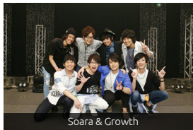
Soara & Growth

Ami nagyon érdekesnek bizonyult az első részek alapján, hogy jó pár jelenetben utaltak arra, hogy valóban a mi időnk szerinti jelenbe tétek a szereplőket. Ez legjobban a SOARA részében figyelhető meg. Ahogy az a bemutatkozásnál is kiderült, Nozomu és Ren egy évvel fiatalabbak, mint a másik három tag, így bár középiskolában találkoztak, volt egy tanév, amikor a három nagy egyetemista volt, a két kicsi pedig a középiskolát gyúrte. Az animében Ren és Nozomu egyetemistaként ismerhetjük meg, szóval ők tavasszal valóban elbállagtak a középiskolából.