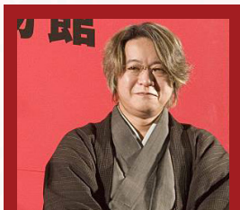
Kyougoku Natsuhiko anime adaptációk

A Mouryou-n kívül az író több regényét is animére vitték, de jóval gyengébb minőségben, elborultabb vagy felejthetőbb történetekkel.