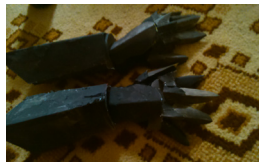
Lady Marilyn (ladym.blog.hu) Otletadó: Miharu cosplay

Aki jobb minőséget szeretne elérni, karton helyett dolgozhat dekoratívval is!