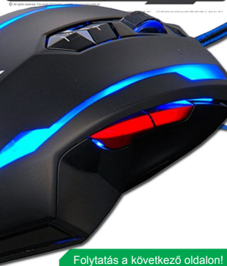
© 2010 A-Jazz. All Rights Reserved. 顶级舒适感，优异的性能与极具诱惑力的外观