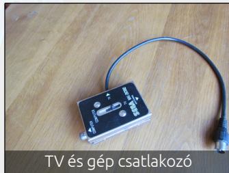
TV és gép csatlakozó

Nem is értettem ezt elsőre, majd mikor a kezembe nyomta a szerkezetet, kezdtem megvilágosodni: ez még abban az időben készült, amikor egyetlen egy csatlakozó volt a tv-n, amiről az adást kapta. Mivel volt elfekvőben egy rakat RCA kábelem, így nagyon könnyen és gyorsan megoldottam a kábelezési problémákat. Már csak az volt hátra, hogy bekapcsoljam és megkerestessem a tv-vel a gép jelét. Digiseknek mondom, hogy a Cartoon Networkre kell csak átkapcsolni.