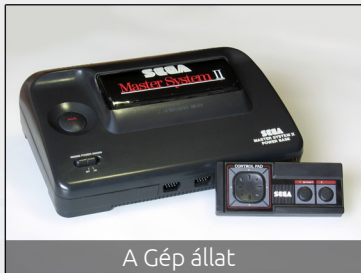
A Gép állat

Ja és ami még ennél is viccesebb: a játékok 256KB-nyi helyet foglalnak.