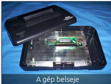
A gép belseje