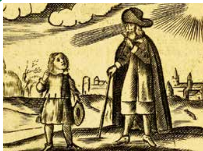
Mester és tanítványa Comenius tankönyvéből

Comenius 350 évvel ezelőtt megfogalmazott elvei a nevelésről, az iskoláról ma is érvényesek. Ő az első modern pedagógus, a nemzetek tanítója. Életműve az egész világe. Nemzetként a csehek, azon belül is a mor-