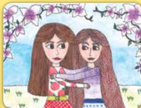
Berényi Dorina, Szabadka

A pályázati feladatok megfejtését honlapunkon közöljük: www.napsugar.ro/megfejtesek.php