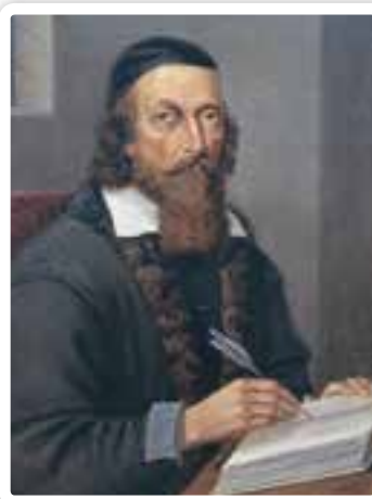
Comenius, a nemzetek tanítója