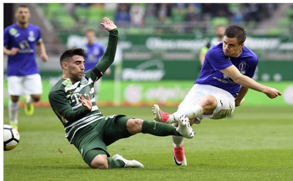
A derbit a Fradi nyerte az Újpest ellen

Debrecenben rendezték az első vidéki kettős mérkőzést. Az első találkozón a dobogón lévő remek formát futó hazai Debrecen a gődörben lévő és a kiesés ellen küzdő Haladást fogadta. A szombathelyiek eddig