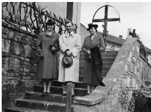
1939 tavaszán az ekkor megnyílt budapesti Lengyel Intézetben

Magyarország német megszállása a lengyel futárbázisok működésének is véget vetett. Március 19-én