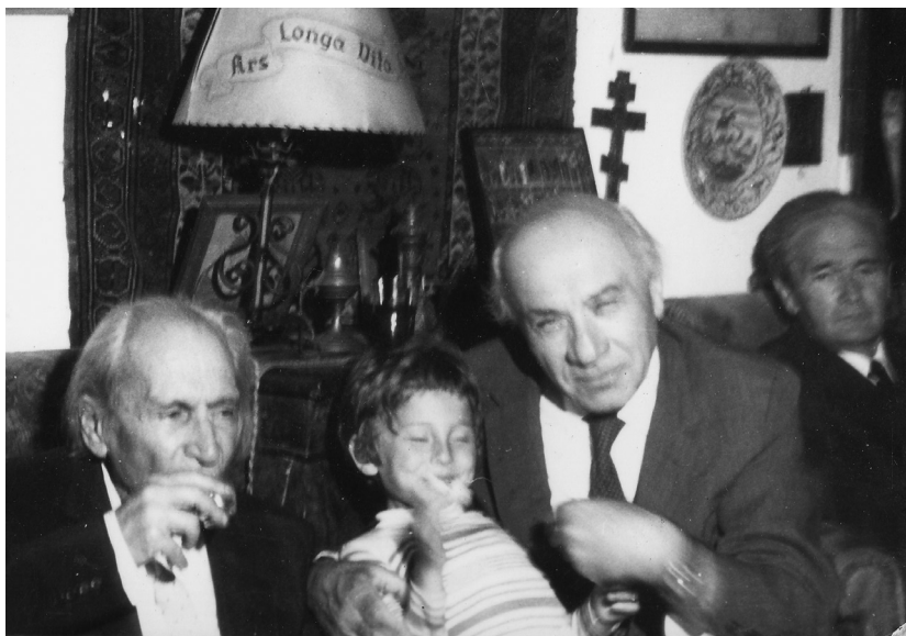
Déry Tibor, Papp Gábor Zsigmond, Illyés Gyula, Németh László (Balatonfüred, 1970)

– Igen, többször is. A nagyobbik fiamnak, akit Papp Gábor Zsigmondnak hívnak, filmrendező, van egy négyéves kori fotója, amint Gyula bácsi ül, Déry