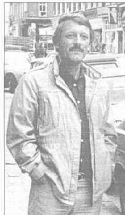
NAGY PÁL (1934.) Franciaországban élő magyar író, tipográfus. Alapítója a párizsi Magyar Műhelynek és a D'atelier című francia folyóiratnak és kiadónak. Munkáit az avantgard vizuális törekvések jellemzik.

Volt egy nagyon érdekes közjáték. Annak illusztrálására is mondom, hogy ebben az időszakban is voltak nagyon derék emberek Magyarországon. Miután